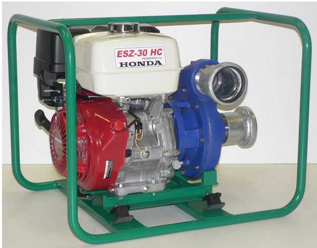
ESZ-30 HC Honda benzínmotorral

Az ESZ-30 HC sorozatú öntözőszivattyúk elsősorban mezőgazdasági öntözési célokra alkalmasak. A szivattyúk szerkezetükből adódóan nagy nyomás mellett tudnak jelentős mennyiséget szállítani, kisebb öntöződobok táplálására kiválóan alkalmasak. Ebből kifolyólag a mezőgazdaságban igen jól használhatók. A meghajtómotor HONDA vagy KOHLER benzinmotor, de lehet LOMBARDINI dízelmotorral is rendelni. Bármelyik motor hosszú élettartamot és megbízható, gazdaságos üzemelést biztosít.