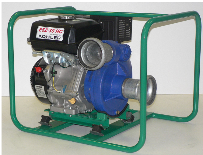
ESZ-30 HC KOHLER benzínmotorral

600 liter / perc 80 méter víz / öntöző LOMBARDINI 15LD500 dízel 12 LE 3600/perc 6 méter 3" 78x58x61 cm 92 kg